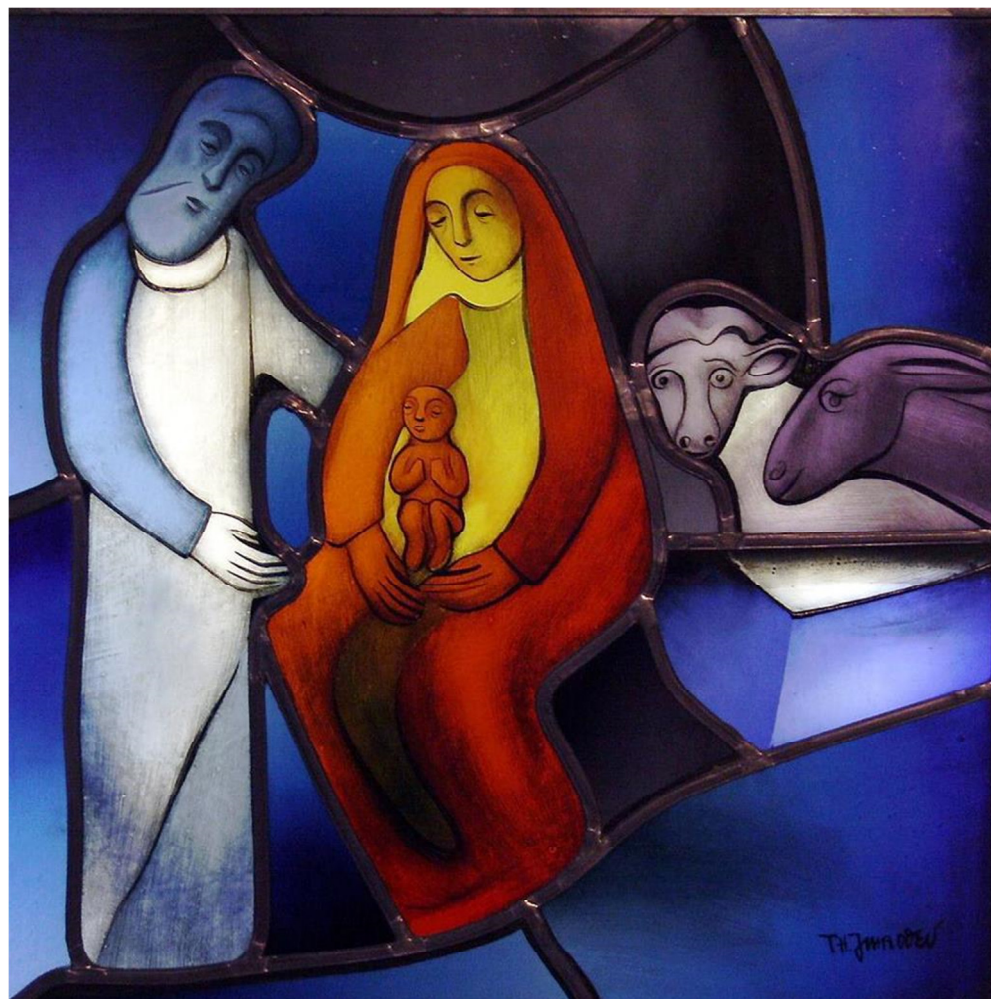
Theo Imboden, Marienfenster in der Kirche von Grächen, 1986